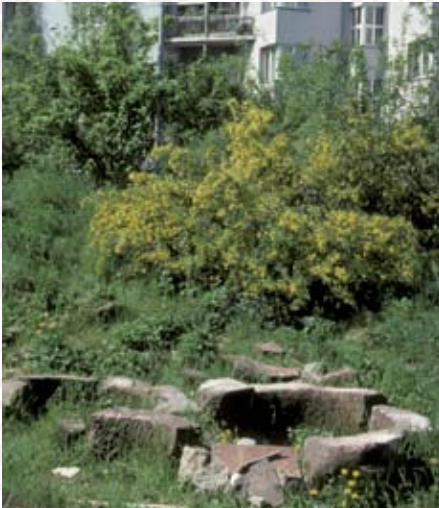
Sitzplatz mit fließendem Übergang zur Umgebung

Plätze und Wege sind oft die meistbenutzten Gartenbereiche und haben eine wichtige gliedernde wie auch verbindende Funktion. Die Qualität eines Platzes wird nicht nur von der Art des Belages, sondern ebenso von seiner Form und Einbettung in die Umgebung bestimmt. Niveauunterschiede können durch Trockenmauern, Nischen und Treppen abwechslungsreich gestaltet werden.