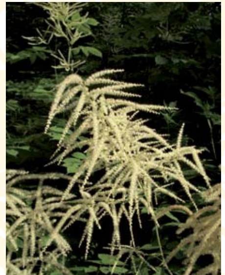
Wald-Geissbart ( Aruncus dioecus )