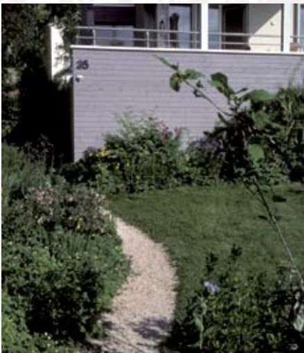
Spannende Wegführung belebt den Garten

Wasserdurchlässige Beläge wirken weniger monoton als versiegelte Böden, bieten Lebensraum für Tiere und Pflanzen und verhindern, dass sauberes Regenwasser in die Kanalisation abfließt.