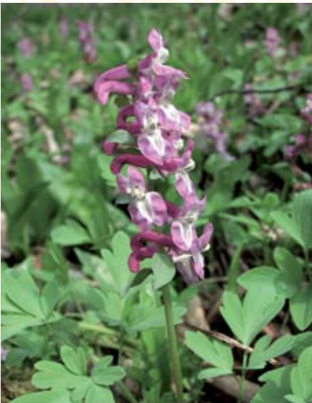
Hohlknolliger Lerchensporn ( Corydalis cava )