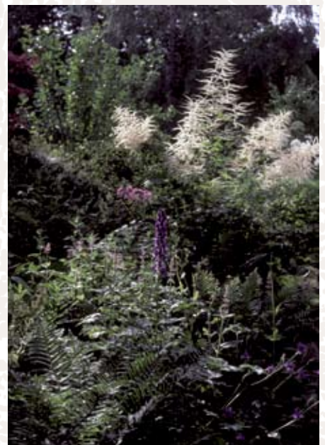
Schattenstauden auf kühlfeuchtem Lehmboden