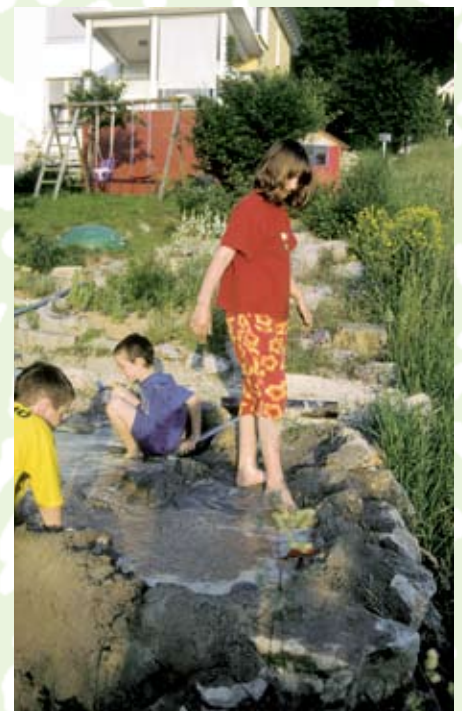
Ein Sandkasten mit Wasser begeistert die Kinder