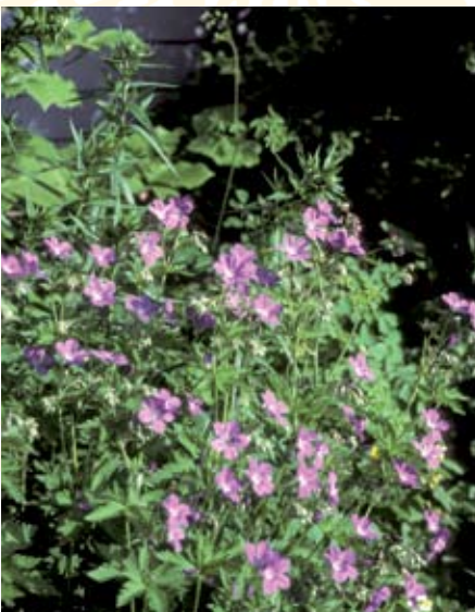
Wald-Storachschnabel ( Geranium sylvaticum )