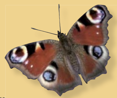
Die Raupe des Tagpfauenauges lebt auf Brennnesseln

Zahlreiche weitere Strukturen können den naturnahen Garten bereichern und erfüllen idealerweise eine Mehrfachfunktion als Spiel- und Gestaltungselemente, als Beobachtungsmöglichkeiten und als Lebensraum für Tiere und Pflanzen.