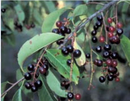
Früchte des Gewöhnlichen Schneeballs ( Viburnum opulus )