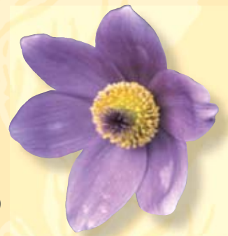
Gemeine Küchenschelle (Pulsatilla vulgaris)