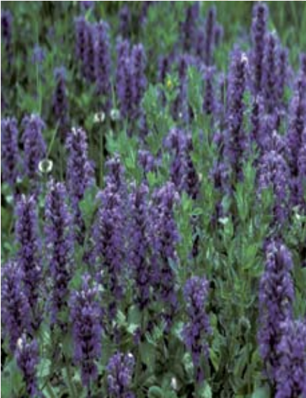
Der Genfer Günsel setzt Farbtupfer in den Blumenrasen

Rasenflächen nehmen oft einen grossen Teil des Gartens ein. Obwohl der Rasen ein anspruchsvoller und aufwändiger Grünbereich ist, wird er häufig auf Flächen angelegt, welche gar keine Nutzfunktion (Spielen, Liegen) erfüllen. Dabei gibt es ansprechende Alternativen.