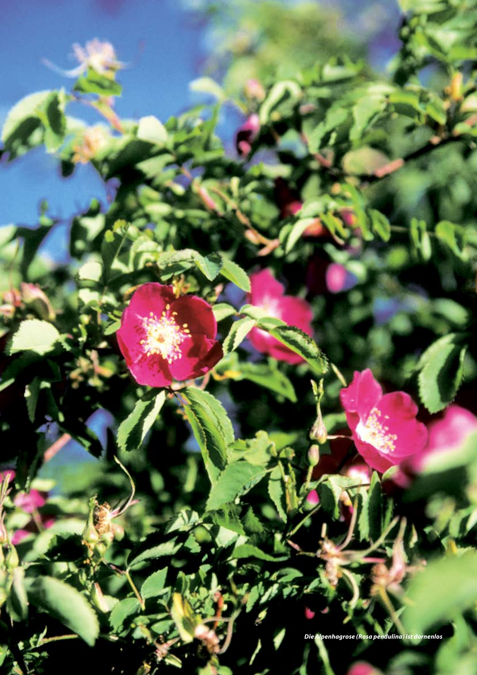
Die Alpenhagrose ( Rosa pendulina ) ist dornelos