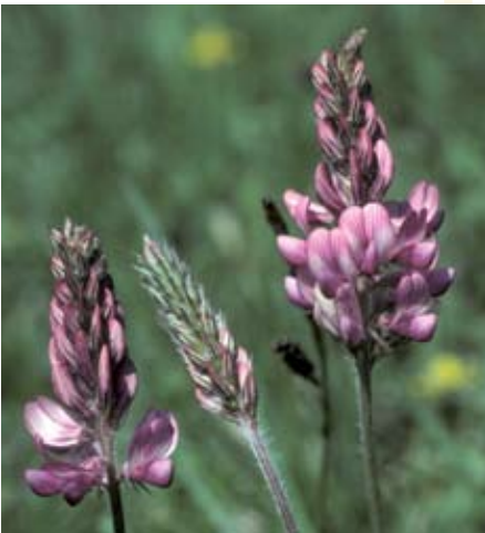
Esparette ( Onobrychis viciifolia )

Je nach Wunsch kann ein Blumenrasen 5–10-mal pro Saison geschnitten werden. Die Schnitthöhe und -häufigkeit entscheidet mit darüber, welche Kräuter im Blumenrasen überleben können.