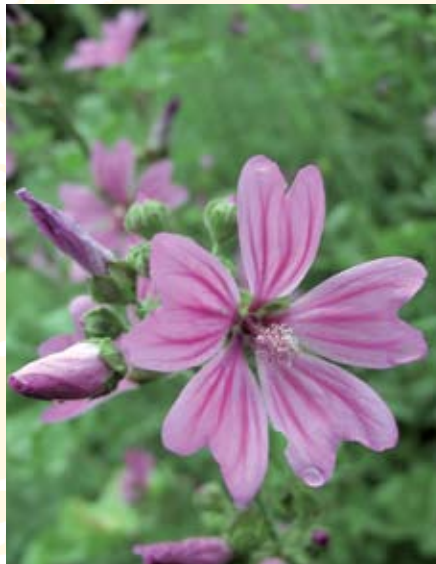
Wilde Malve ( Malva sylvestris )