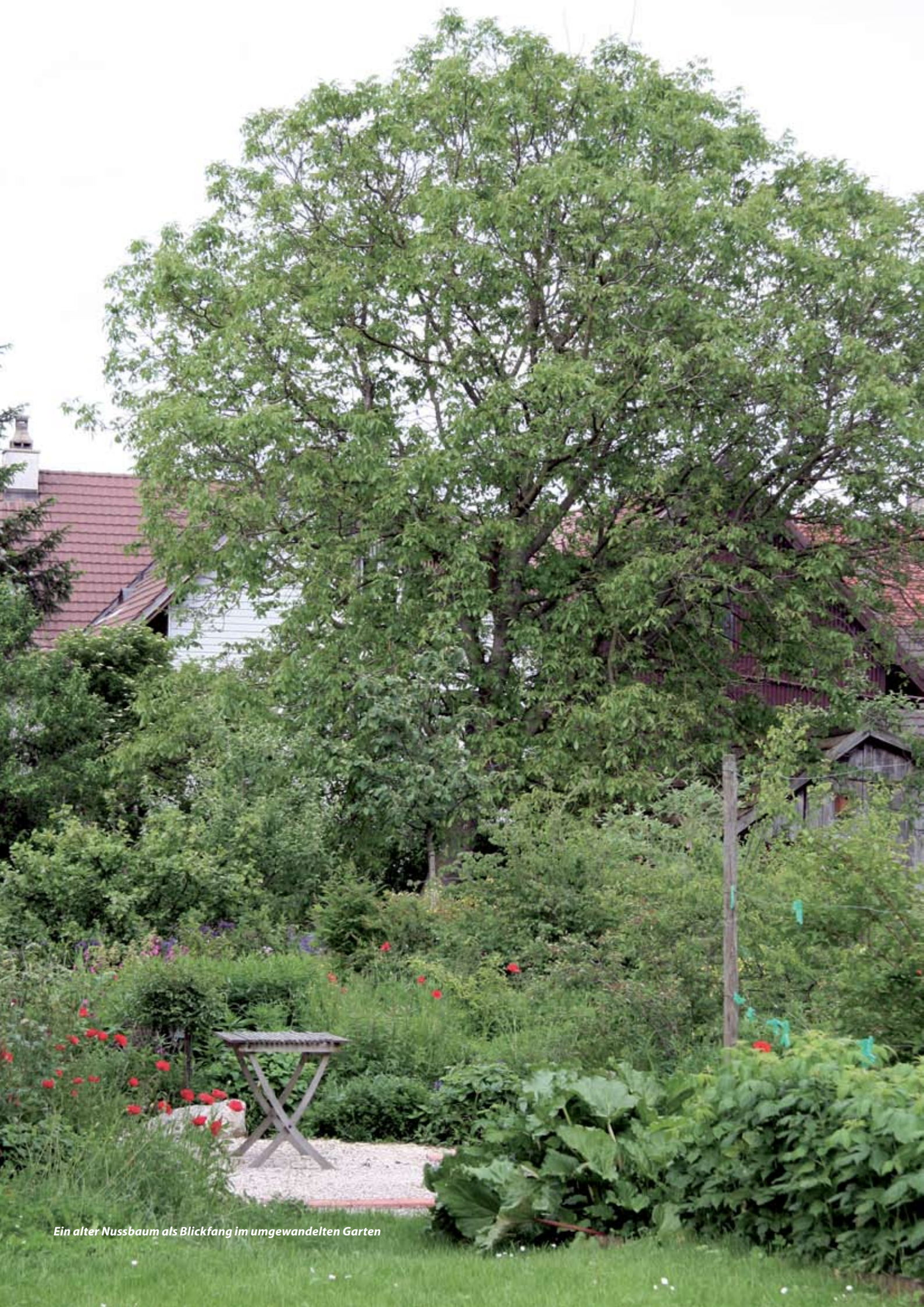
Ein alter Nussbaum als Blickfang im umgewandelten Garten