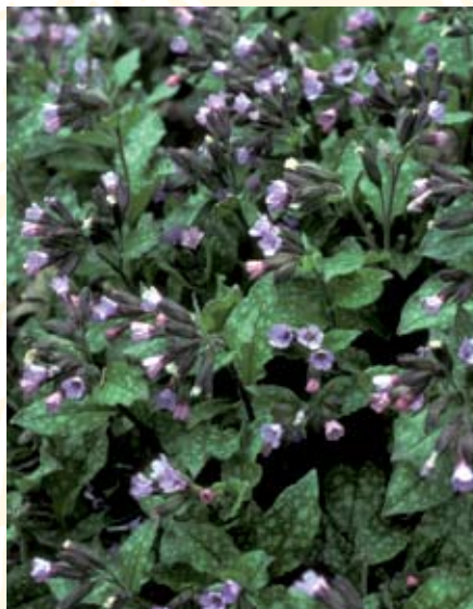
Lungenkraut ( Pulmonaria officinalis )