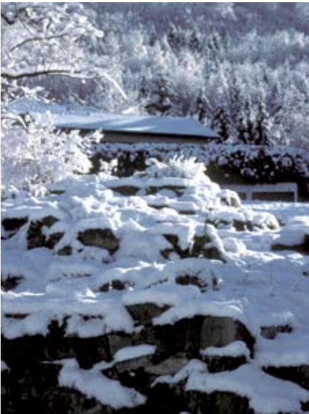
Strukturreichtum auch im Winter