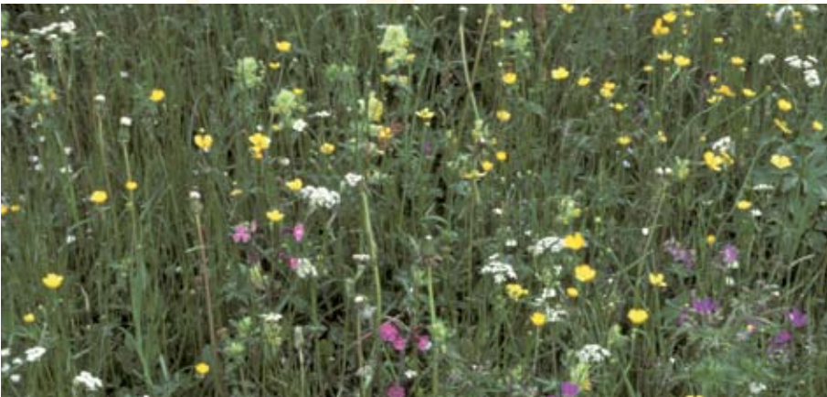
Artenreiche Blumenwiese für ungenutzte Gartenbereiche

Intensiv genutzte Rasen oder Blumenrasen lassen sich gut mit Staudensäumen entlang von Gehölzen und Mauern kombinieren. Eine geschwungene Linienführung führt dabei zu spannenden Übergängen. Grosse Rasenflächen können mit Wildstaudenrabatten oder Gehölzen abwechslungsreich gegliedert werden.